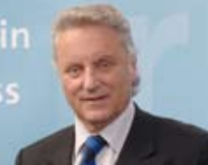
Dieter Patt, Landrat Rhein-Kreis Neuss