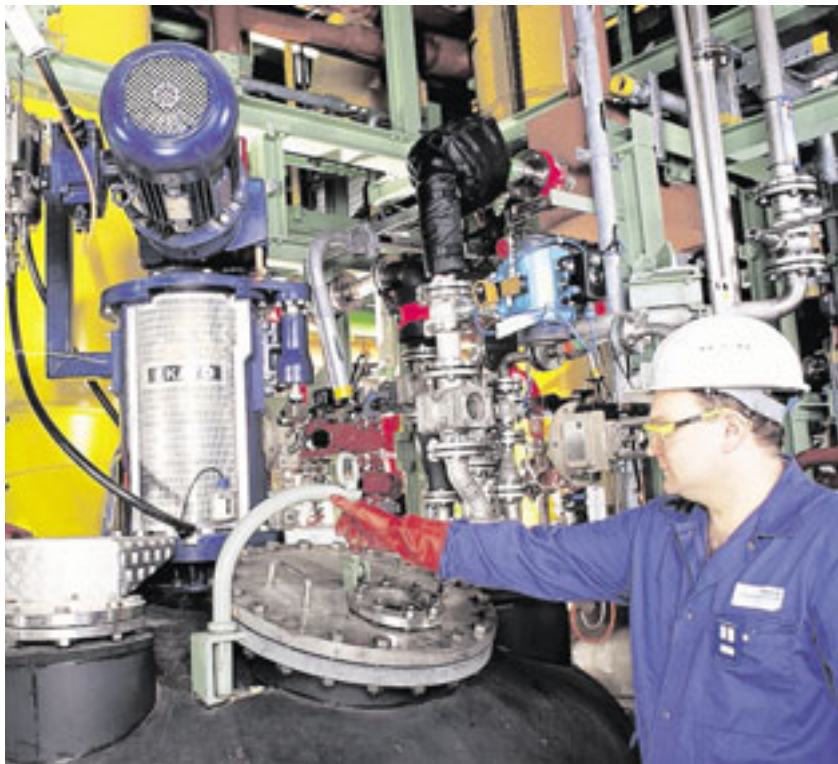
Bei der Produktivität liegt der Rhein-Kreis Neuss auf Platz 3 in NRW.

Der Rhein-Kreis Neuss gehört mit Rang 5 unter allen 54 Kreisen und kreisfreien Städten zu den Top-Standorten in Nordrhein-Westfalen, auch wenn er gegenüber 2006 um drei Plätze nach hinten rutschte. Spitzenreiter ist der Kreis Olpe vor Düsseldorf. Bundesweit belegt der Rhein-Kreis Neuss nach der neuen Studie Platz 102 (2006: 69). Laut INSM-Studie zählt er zu den wohlhabendsten Regionen (Platz 23 im Bund, Platz 4 in NRW) und zu den produktivsten (Platz 12 im Bund, Platz 3 in NRW). Insbesondere