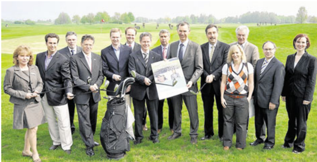
Vorfreude aufs Golf-Spektakel: Organisatoren und Sponsoren des „WFG Business Cup 2009“.

Das Zauberwort heißt „Networking“. Und wo geht das besser als am Freitag, 10. Juli, im Golfpark Rittergut Birkhof in Korschenbroich? Dort wird das Turnier um den „WFG Business Cup 2009“ ausgetragen.