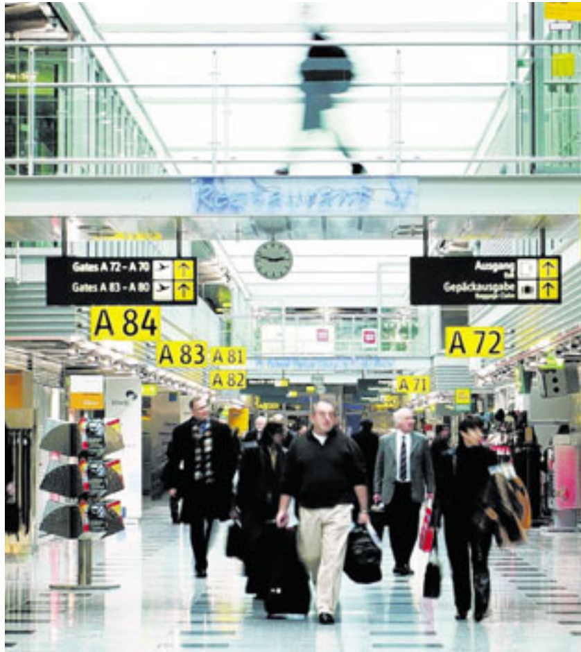
Der Flughafen Düsseldorf International dient als weltweite Drehscheibe.

Neben den weltweiten Verkehrsverbindungen für Geschäftsreisende galt ein Hauptaugenmerk beim Blick auf Düsseldorf International dem im Wirtschaftsleben ebenso unentbehrlichen Frachtbereich. Die Firma DUS Cargo Logistics ist eine 100-prozentige Tochter der Flughafen Düsseldorf GmbH und zeichnet dafür verantwortlich. Sie wickelt für ihren größer werdenden Stamm an Kunden den Importfracht-Umschlag fast aller am Airport ansässigen Fluggesellschaften ab. Außerdem führt sie das Exportlager für mehr als 30 Airlines. Im