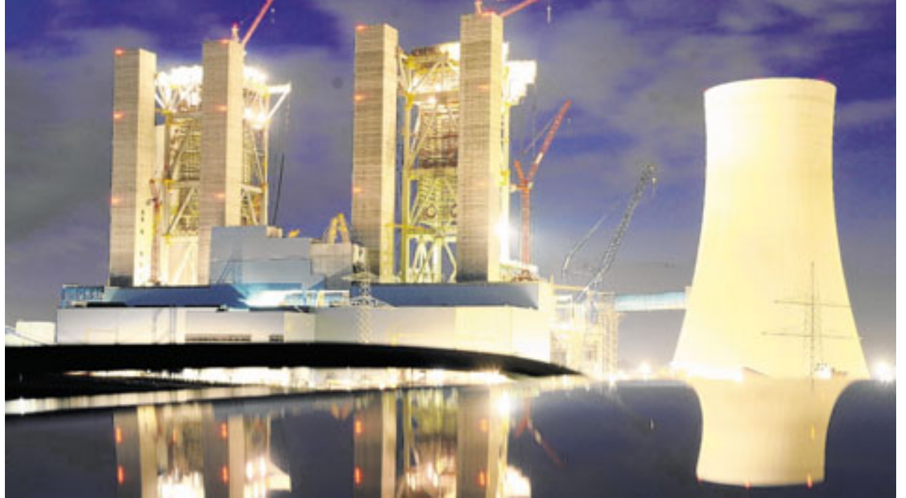
Die BoA-Baustelle bei Neurath setzt Zeichen in der rheinischen Energie-Landschaft.

Die Industrie- und Handelskammern in NRW stellten jüngst ihre „Energiepolitischen Positionen 2009“ vor. Die Essenz des Papiers, für das 400 Unternehmen befragt worden waren: Kernkraft dürfe kein Tabu sein, wenn es darum gehe, eine kostengünstige, sichere und umweltverträgliche Energieversorgung zu gewährleisten. So formuliert es Paul Bauwens-Adenauer als Präsident der IHK-Vereinigung NRW. Das positive Signal an den Kohlestandort Rhein-Kreis Neuss: Die Förderung der Braunkohle soll als gleichwertiger Energieträger genutzt und nicht zurückgefahren werden. Das fordert auch Werhahn: „Alle Energieträger, von der heimischen Braunkohle bis zur Kernenergie, müssen international die gleichen Wettbewerbsbedingungen ha-